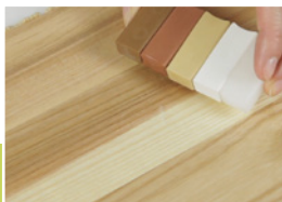
2 Výběr barev

Poškozené místo před opravou očistěte, vysušte a odmaštěte. Odstraňte případně volné, vyčnívající části.