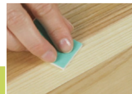
12 Sjednocení lesku

Přelakujte rovnoměrně v jednom směru pouze opravené místo. Pro doplnění laku do hrotu opět zmáčkněte fix v místě „P“. Po použití hrot umyjte ve vodě a vysušte ho.