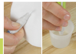
9 Odvzdušnění fixu

Pro ochranu opravy před prachem a nečistotami je nutné provést lakování fixem Pinsel-Fix® AQUA. Protřeptejte fix cca. 30 sekund. Musí být slyšitelné míchací kuličky.