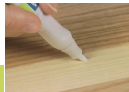
11 Přelakování opravy

Fix držte hrotem dolů nad bavlněným hadříkem a opatrně zmáčkněte opět v místě označeném „P“. Tímto způsobem proudí lak do hrotu fixu. Lehce odstraňte přebytečný lak z hrotu do hadříku, abyste neprováděli lakování příliš na mokro.