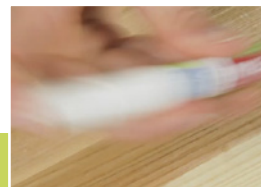
8 Protřepání fixu

Opravené místo odmaštěte šedou brusnou tkaninou, čímž zároveň zmatíte i lesklý vosk.